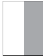
½ pysty 107 x 280 mm