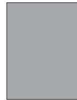
1/1 sivu 215 x 280 mm