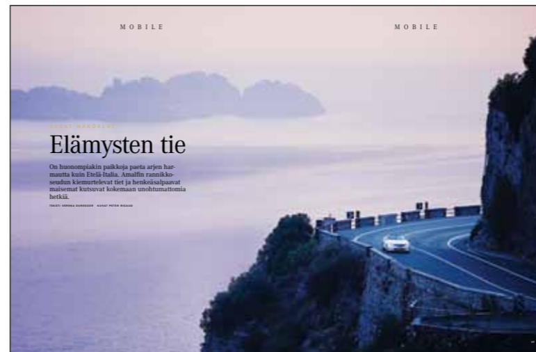
Mobile vie lukijat mielenkiintoisiin matkakohteisiin ja tarjoaa virkeitä ihmisille, jotka haluavat pysyä liikkeellä.