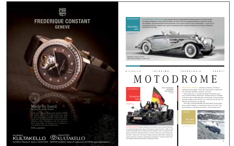
Motodrome kertoo, mitä tapahtuu varikolla ja autourheilun kulisseissa. Varsinkin F1- ja DTM-sarjojen taustat tulevat Motodromen sivuilla tutuksi.