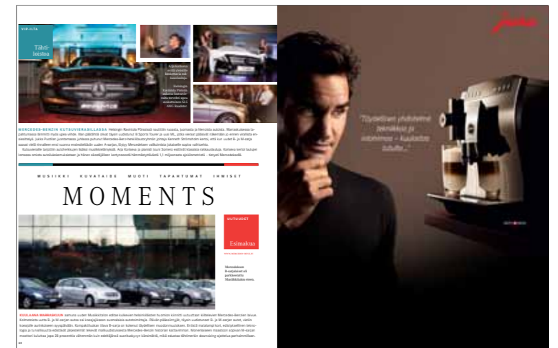
Moments nauttii juhlahetkidestä. Näillä sivuilla esiin pääsevät muoti, musiikki, tapahtumat ja ilmiöt.