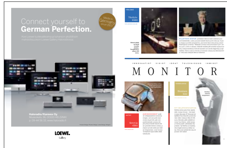
Monitor sisältää mielenkiintoisia uutisia teknologiasta, uusista innovaatioista sekä tulevaisuuden visioista.

MERCEDES-BENZ MAGAZINEN sisältö jakaantuu kuuteen osioon. Ne kulkevat nimillä Monitor , Magazine , Motodrome , Modern , Mobile ja Moments . Kukin osio tarjoaa ilmoittajille mielenkiintoisia määräpaikkoja, jossa mainostettava tuote tai palvelu on sijoitettuna sille sopivaan mediaympäristöön.