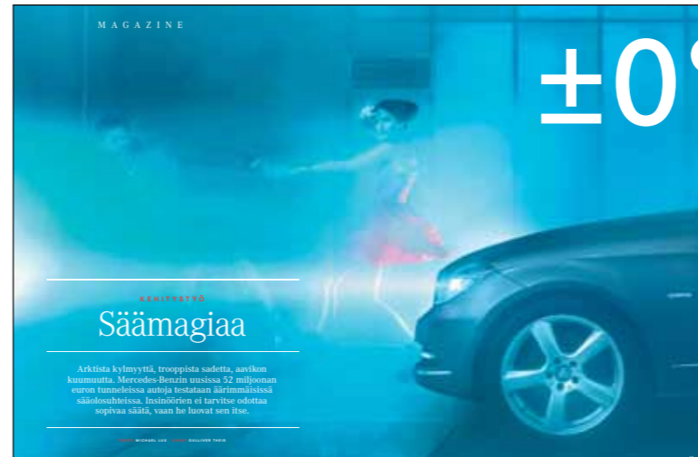
Magazine esittelee uusimmat Mercedes-mallit ja autoihin tehdyt faceliffit. Kattavat jutut on kuvitettu näyttävillä ja tasokkailta kuvilla.