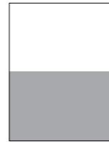
½ vaakaa 215 x 140 mm