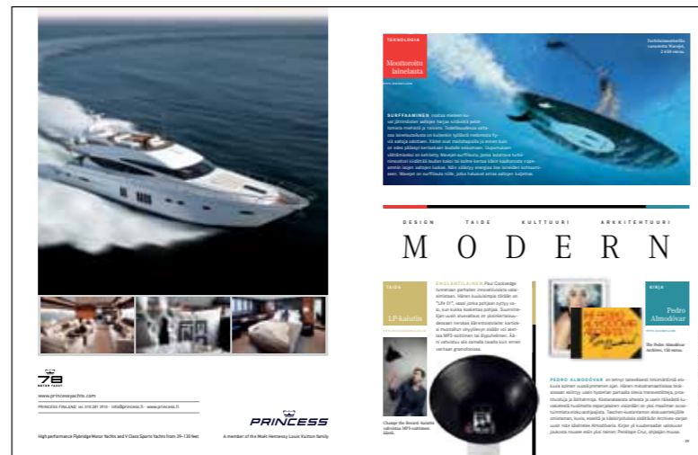
Modern on muotoilun, kulttuurin ja lifestylen foorumi. Se tarjoaa lukijoilleen uusimmat trendit ja näkymät meiltä ja maailmalta.